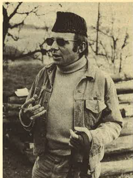
MACHT. Ik was de leider van een privéleger, van een gewapende bende. God, wat een machtspositie.

— Geeraerts: Ik heb dat in mijn boek gezet om de ogen te openen. Onze helden in Stan hebben zich gedragen als beesten. Als de overheid zou zeggen dat het niet waar is, publiceer ik honderd vraaggesprekken met soldaten die hebben meegedaan. Ze moesten zich onmenselijk gedragen, anders gingen ze er zelf aan. De kolonels die de operatie leidden hadden vooraf trouwens op zestig gesneuvelden gere-