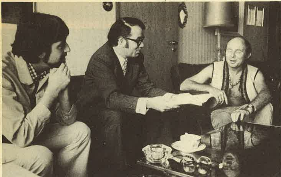
JOURNALISTEN. Ze zoemen als muggen rond mijn kop.

en begin september van dit jaar, in een koorts en met veel eenzaam leven. Ik ben nu bezig er, voor de zesde druk, fouten en overstatements uit te halen.