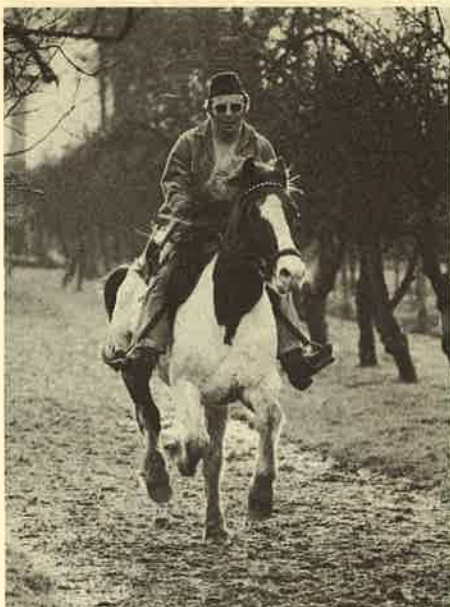
HOROS. Als je me verlaat, zul je dit paard doden.

— Geeraerts: Ik was de enige die door de zwarten zo goed aanvaard werd. Overdag ging ik er met de vuist op, wanneer ze niet opschoten met hun brug. Ik reed rond met een zware BMW-motor (maakt roem-vroem-geluiden met zijn polsen) en met een zwarte op het tweede zadel. Ik deed vaak vierhonderd kilometer per dag, zodat ik voortdurend last kreeg vanwege de administratie omdat ik weer niet op kantoor was. Ik palaverde in het Lingala met de dorpsbewoners en in hun eigen woordenschat (klotten, laffe honden, moedige luipaarden) en woonde hun rituele feesten bij. Honderden hebben geprobeerd met ze op jacht te gaan. Alleen ik mocht dat. Ik ben ingewijd in de stam van de Bokoï toen ik net een olifant met twee schoten gedood had, na een achtervolging van tien uur. En tijdens mijn militaire veldtocht tegen de Baloeba's roken mijn zwarte soldaten instinktief dat ik verstand had van machinegeweren, radiatoren, munitie en proviand. Daarmee was ik een