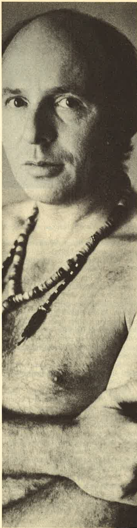
OVERLEVEN. Maar je moet er een sterk, instinktief lijf voor hebben.